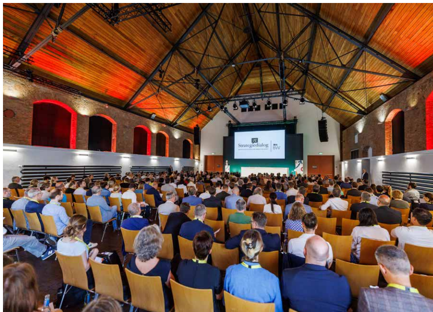
Gut besucht: Die Hauptbühne während der Veranstaltung.

„Die Situation auf dem Wohnungs- und Immobilienmarkt sowie im Bausektor stellt eine der größten gesellschaftlichen Herausforderungen dar. Angesichts hoher Baukosten, abgesagter Projekte und Insolvenzen bleibt die Lage angespannt. Im Strategiedialog erarbeiten rund 200 Expertinnen und Experten auf Hochtouren Lösungen, um diesen Problemen zu begegnen. Es freut mich sehr, dass die ersten Ergebnisse vorliegen und Projekte jetzt umgesetzt werden. Wir brauchen das gebündelte Wissen des Strategiedialogs, um konkrete Maßnahmen für die Landesregierung zu entwickeln“, erklärte Ministerpräsident Winfried Kretschmann am Mittwoch, den 26. Juni 2024, bei der Eröffnung der zweiten Jahresveranstaltung des Strategiedialogs „Bezahlbares Wohnen und innovatives Bauen“ im Römerkastell in Stuttgart. Im Fokus der diesjährigen Veranstaltung stand eine gemeinsame Rückschau auf die bisher erzielten Erfolge sowie ein Ausblick auf die nächsten Schritte und zukünftigen Projekte des Strategiedialogs. Am Vormittag stellten die Ministerin für Landesentwicklung und Wohnen, Nicole Razavi, die Ministerin für Wirtschaft, Arbeit und Tourismus, Dr.