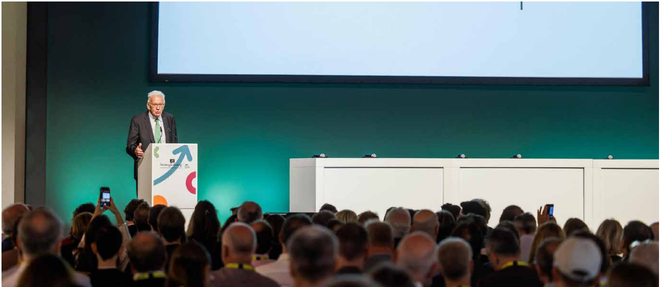
Beliebtes Fotomotiv: Winfried Kretschmann während seiner Rede.

bereits freigesetzt hat, müssen weiter genutzt werden. Die Umwälzungen in der Bau- und Wohnungsbranche sind enorm, und wir müssen gemeinsam dafür sorgen, dass der Wohnungsbau nicht ins Stocken gerät. Der Strategiedialog kann dabei einen wesentlichen Beitrag leisten, indem er den Dialog zwischen Politik und Wirtschaft zu den drängenden Themen des Bauens stärkt. Dies ist ein entscheidender Schritt, um das gegenseitige Verständnis für Handlungsspielräume, konkrete Ziele und sinnvolle Maßnahmen zu fördern.“ In den vom Bauministerium verantworteten Themensäulen des Strategiedialogs werden derzeit zentrale Themen bearbeitet. Dazu gehören Vorschläge zur Aktivierung von Wohnraum im Bestand, um bezahlbaren Wohnraum auf den Markt zu bringen, sowie zahlreiche Projekte, die sich auf zirkuläres Bauen und die nachhaltige Transformation des Gebäudebestands konzentrieren.