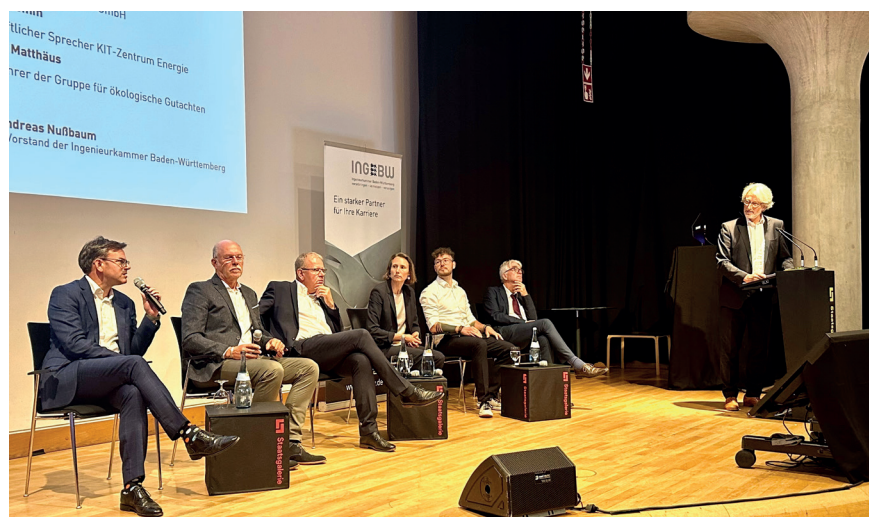
Auf dem Podium des 8. Ingenieuretags wurde über die Chancen und Herausforderungen der Energiewende diskutiert

Der achte Ingenieuretag der Ingenieurkammer am 28. Juni stand unter dem Motto „Clean Energy – Ingenieure gestalten die Energiewende“. Auf dem Fachkongress diskutierten Ingenieure, Wissenschaftler, Verbands- und Unternehmensvertreter über die Energiewende. Anschließend unterstrich beim abendlichen Empfang Umweltministerin Thekla Walker das große Potential von Ingenieurinnen und Ingenieuren in Baden-Württemberg – nicht nur beim Thema erneuerbare Energien.