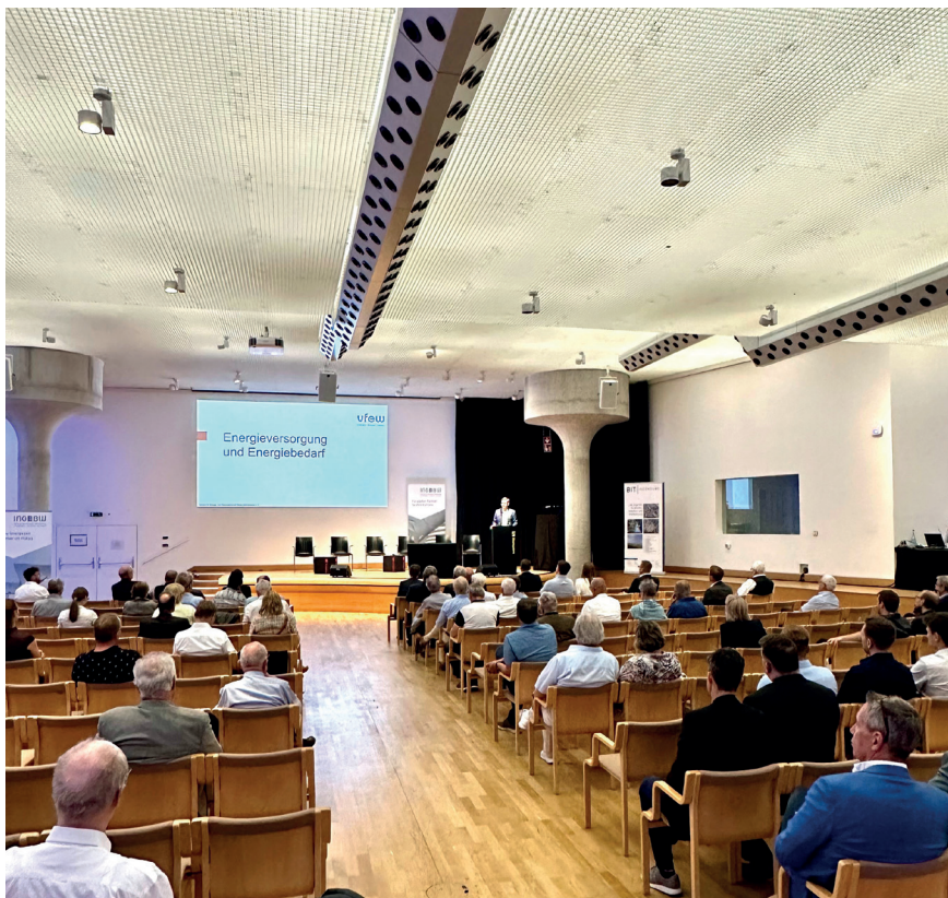
Der 8. Ingenieuretag fand wie gewohnt in der Neuen Staatsgalerie in Stuttgart statt.