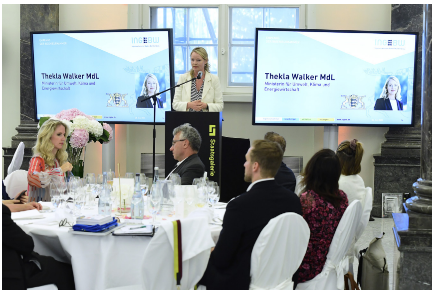
Umweltministerin Thekla Walker hielt die Hauptrede beim Empfang der Ingenieurkammer

Auch auf das Thema Wasser legte sie einen besonderen Fokus in ihrer Rede. So käme man um diese Thematik mit Blick auf Klimawandel und Resilienz nicht herum. Viele Starkregen-Hochwasser und Hitzeereignisse in den vergangenen Jahren und Monaten hätten gezeigt, dass man sich gut vorbereiten müsse. So gelte es darüber nachzudenken, wie die Infrastruktur geplant werden müsse, um mit den Wetterextremen umzugehen. Bei den zahlreichen Planungsprozessen sei die Hilfe der Ingenieure notwendig. „Ich zähle auf Sie, dass wir zusammen, dass wir gemeinsam diese Herausforderung annehmen, anpacken und in den nächsten Jahren zügig umsetzen“ gab sie den anwesenden Ingenieuren auf dem Empfang Ingenieurkammer zu verstehen.